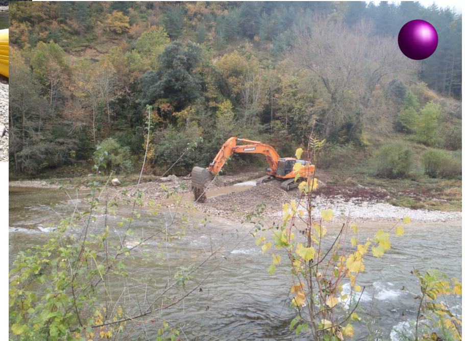
Dans le lit mouillé